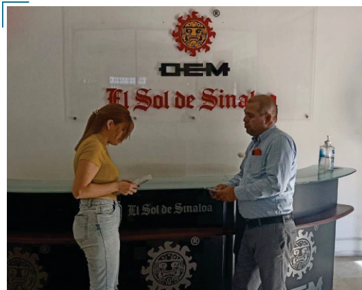
Acercamiento con personal del Periódico “El Sol de Sinaloa”