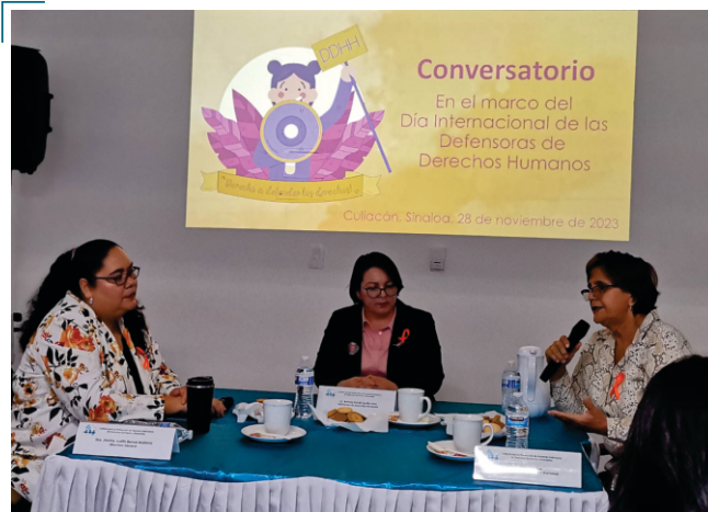
Conversatorio en el marco del Día Internacional de las Defensoras de Derechos Humanos

General de Capacitación y de otras áreas estuvieron presentes en el conversatorio en el marco del Día Internacional de las Defensoras de Derechos Humanos dentro de los 16 días de activismo en contra de la violencia de género.