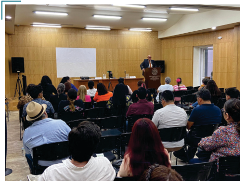
Curso: “Evolución, Logros y Desafíos del Sistema Interamericano de Derechos Humanos”