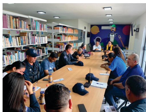
Capacitación a servidores públicos de Badiraguato