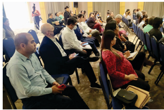
Jornada por la Protección: Periodismo y Defensa de Derechos Humanos