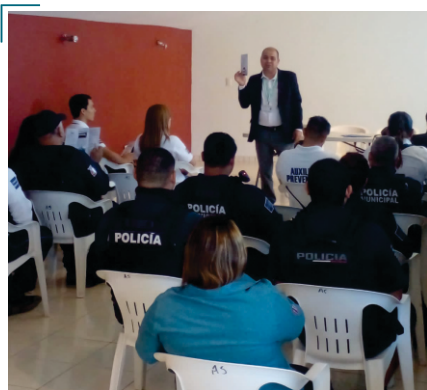
Capacitación a servidores públicos de Salvador Alvarado

Con el Programa Itinerante “El INSTITUTO DE PROTECCIÓN VISITA TU MUNICIPIO”, se tuvo presencia en los municipios de Angostura, Salvador Alvarado, Mocorito y Badiraguato durante los días 09 y 10 de noviembre del presente año, desarrollando actividades de capacitación, entrevistas, acercamientos, etc.